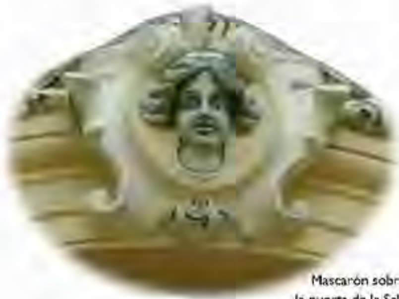
Mascarón sobre la puerta de la Sala "Juan Sebastián Bach"

SECRETARÍA DE EDUCACIÓN PÚBLICA DIRECCIÓN GENERAL DE PROFESIONES DIRECCIÓN GENERAL DE INVESTIGACIÓN Y DESARROLLO TECNOLÓGICO DIRECCIÓN GENERAL DE EVALUACIÓN Y CALIDAD DIRECCIÓN GENERAL DE FOMENTO Y PROMOCIÓN DIRECCIÓN GENERAL DE INFORMACIÓN Y COMUNICACIÓN DIRECCIÓN GENERAL DE RECURSOS HUMANOS DIRECCIÓN GENERAL DE SERVICIOS ESCOLARES DIRECCIÓN GENERAL DE TRABAJO SOCIAL DIRECCIÓN GENERAL DE VINCULACIÓN Y SERVICIOS COMUNITARIOS