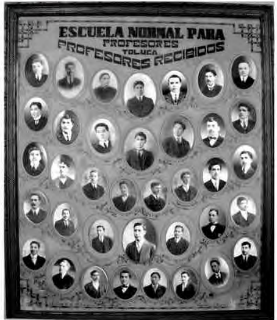
La clave del éxito de una escuela son los buenos maestros. Dr. Gustavo Baz P.