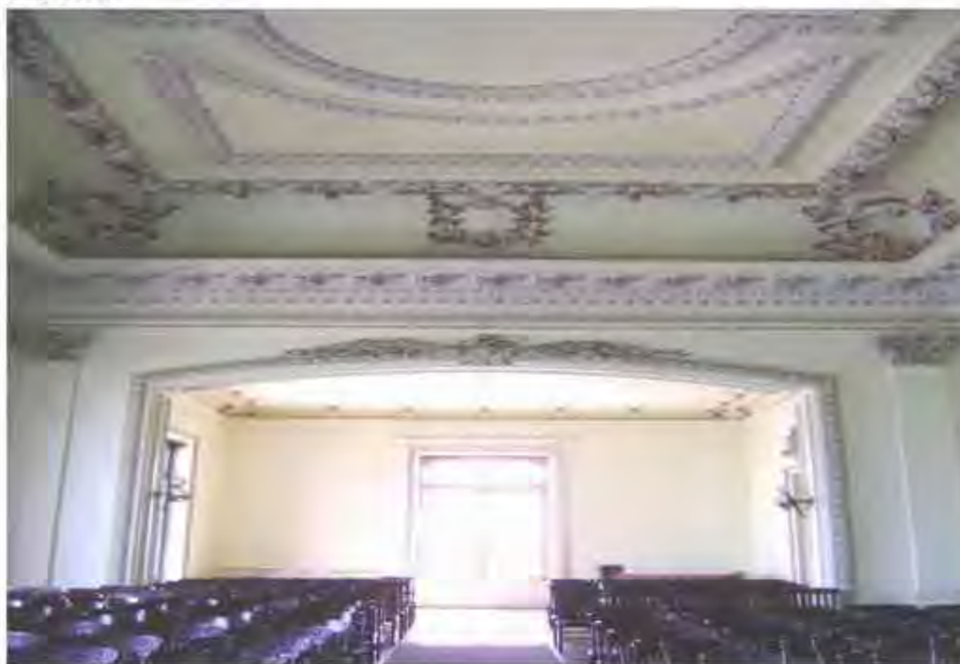
Vista posterior de la Sala "Juan Sebastián Bach".

(Se repite desde que en tus forjas... y fin).