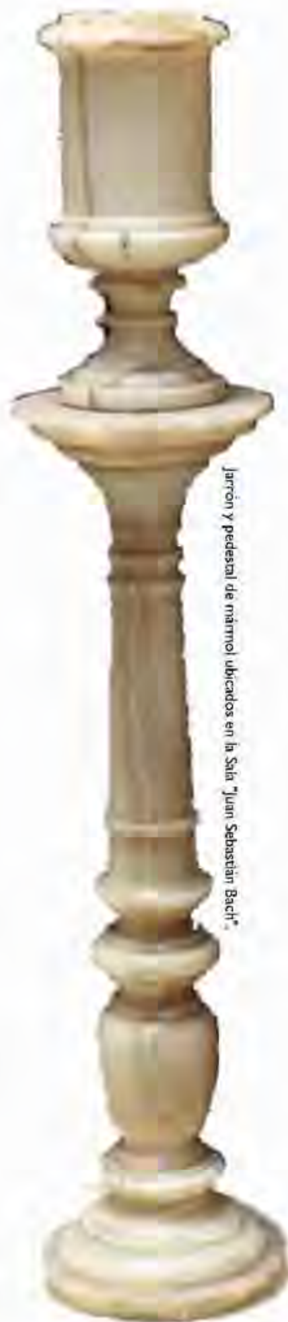
Jarrón y pedestal de mármol ubicados en la Sala "Juan Sebastian Bach".