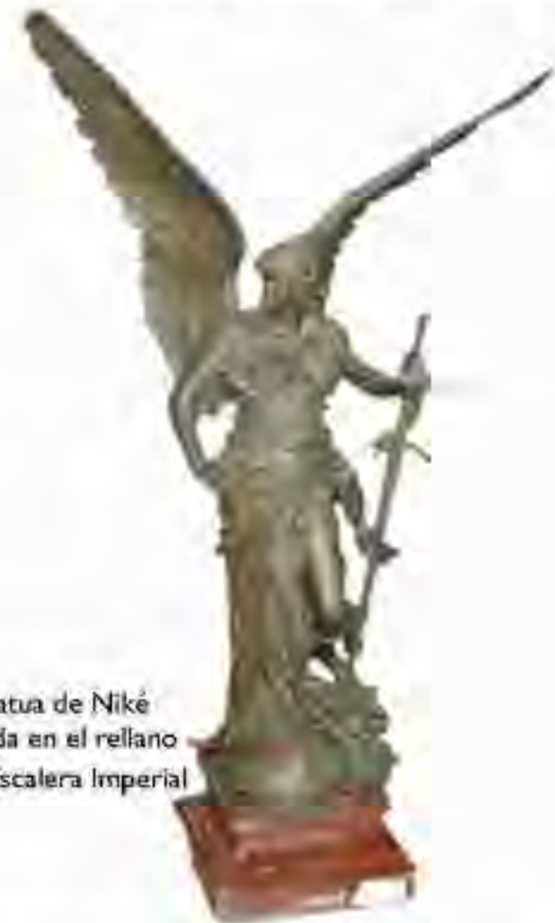
Estatua de Niké ubicada en el rellano de la Escalera Imperial

En la película se expone buena parte del pensamiento educativo y político de Vasconcelos, se deja entrever que la campaña de éste inició en Toluca.* Culmina con la fatal escena de aquel 11 de febrero del año 1931, en que Antonieta se quita la vida en la Catedral de Notre Dame, de París, Francia. Una excelente película que nos remite a reflexionar sobre sucesos importantes que impactaron en la historia nacional y que por su condición humana mezclan sentimientos, pasiones conjugadas con tintes políticos y de creación artística y cultural. Pero sobre todo nos permite visualizar la visión de una mujer que rompió con los esquemas de su época y buscó la trascendencia más allá de lo cotidiano a lo que normalmente estaba destinada la vida de la mujer.