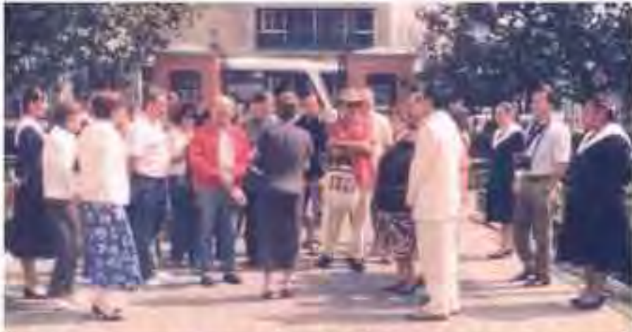
Maestros, alumnos e integrantes del Patronato recibiendo a los visitantes de ICOMOS a la entrada de la Normal para Profesores.