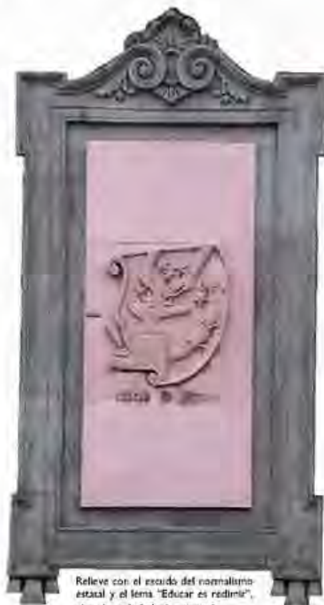
Relieve con el escudo del normalismo estatal y el lema "Educar es redimir", ubicado en la fachada principal