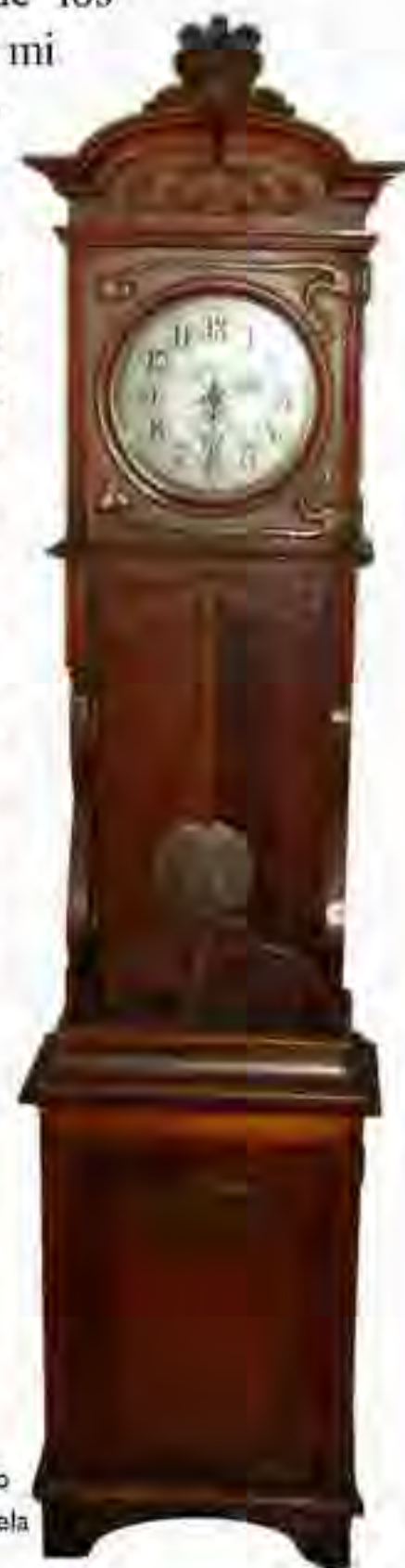
Reloj de péndulo ubicado en la Dirección de la Escuela

Las alumnas actuales del memorable centro educativo, unas pueblerinas, otras ciudadinas —similes a las de los tiempos colegiales de mi abuela y de sus condiscípulas—, que ya moran en el etéreo—convertidas en profesoras; en comunión de ideales como las que les han precedido en más de noventa años, con otras técnicas pedagógicas; con otros métodos de enseñanza, cumplirán con los fines que persigue el Estado Mexicano: formar nuevos ciudadanos para el futuro, mediante la instrucción laica dentro del contexto doctrinario del derecho a la educación. Derecho fundamental de todos los mexicanos a la educación básica que por mandato constitucional es laica, pública y gratuita.