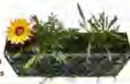
Jardinería decorativa de fierro ubicada en los pasillos superiores

"Parafernalia e Independencia" se puede presenciar en el Museo de Arte Popular ubicado en la Calle de Revillagigedo No. 11, Centro Histórico de la Ciudad de México, hasta el 21 de septiembre de 2008.