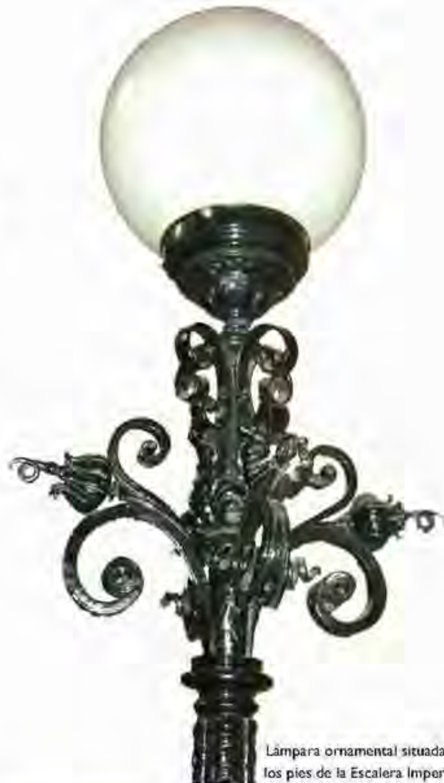
Lámpara ornamental situada a los pies de la Escalera Imperial