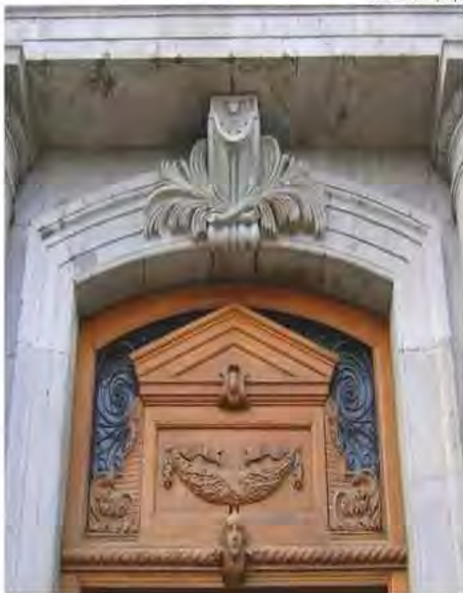
Umbrel de la entrada principal

Bueno, ahora entre brazos amigos recobramos la vereda larga y sus vertientes no todas sosegadas —porque estamos sobre la tierra— de aquel tiempo más feliz que transcurrió en la amada Escuela Normal de Profesores, la cual añade un aniversario más a su vida fecunda. Sin dudar, el magisterio es un apostolado laico. Careciendo de agallas, no se acuda al magisterio. Todos abrigamos en el recuerdo a un maestro en la infancia.