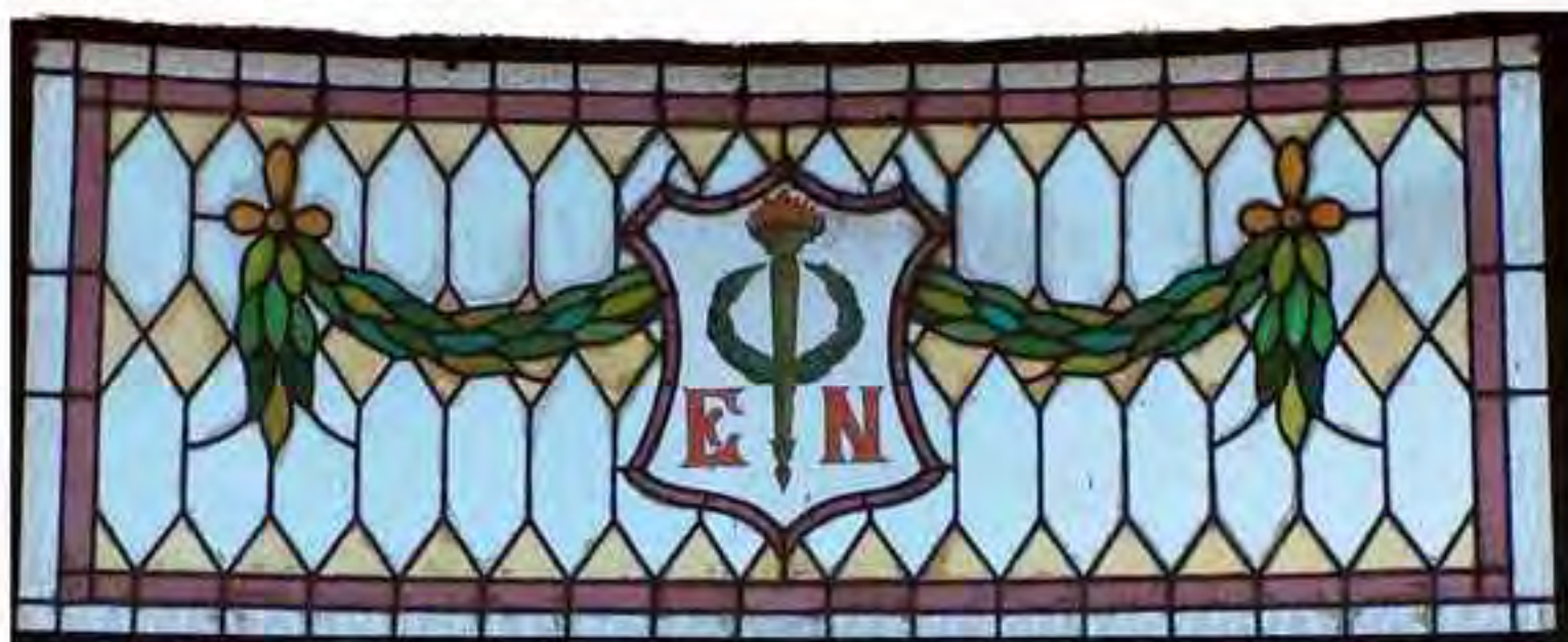
Vitral ubicado en el cubo de la Escalera Imperial