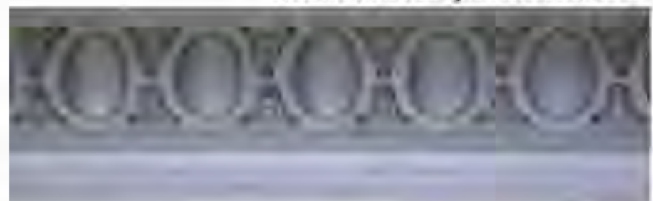
Adorno en la Sala "Juan Sebastián Bach"

Damos las gracias a todos y cada uno de nuestros maestros, por enseñarnos el camino de la creatividad, de la fortaleza y del esfuerzo, lo que nos ha permitido vivir al ritmo de los tiempos.