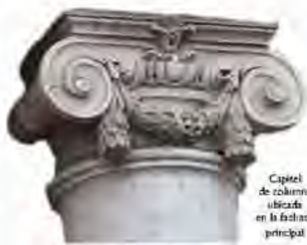
Capitel de columna ubicada en la fachada principal

Muestra de este espíritu de lucha y de trabajo que es marca de la identidad normalista, es esta Revista Conmemorativa del 98 Aniversario de la Inauguración del Edificio Institucional, documento en el que se recoge las voces apasionadas, críticas y reivindicadoras de la labor magisterial y de su profunda huella histórica en la ciudad de Toluca. Invito al lector atento a que recorra estas páginas para que constate una razón más para defender al normalismo nacional.