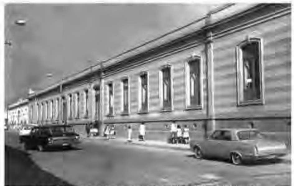
Escuela Primaria Anexa a la Normal "Profra. Eudoxia Calderón G."