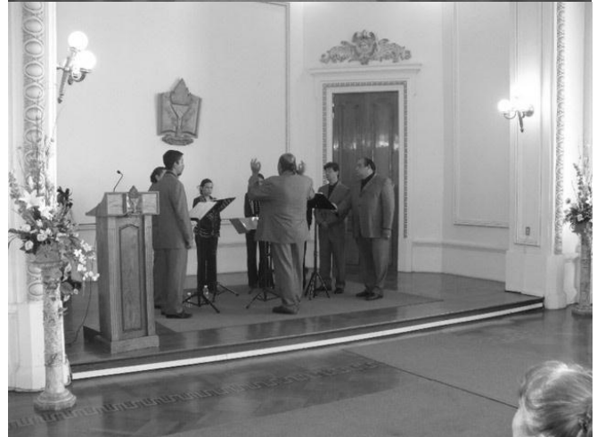
Jueves 25 de octubre: Concierto Octeto Vocal.