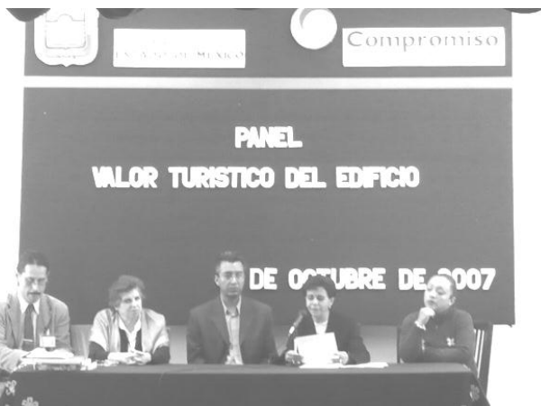
Martes 2 de octubre: Panel “Valor turístico del Edificio”, Secretaría de Turismo y Facultad de Turismo.