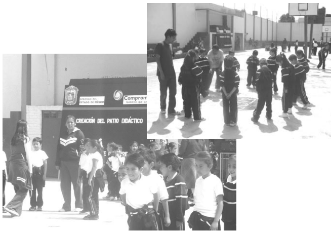
Jueves 11 de octubre: Creación del Patio Didáctico, por los estudiantes del quinto semestre de licenciatura, con la participación de alumnos de las primarias “Eudoxia Calderón Gómez” y “Sor Juana Inés de la Cruz”.