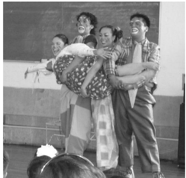
Jueves 4 de octubre: Compañía Teatral “Bambalinas” de la UAEM presenta Ensayo de Payasos .