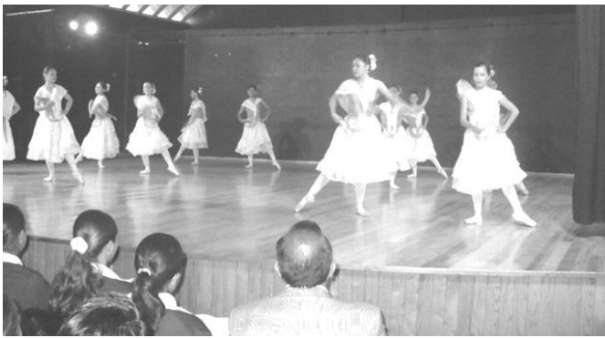
Jueves 18 de octubre: Danza Clásica con el grupo representativo de la EBAEM.