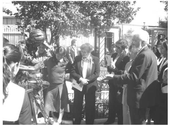
Martes 16 de octubre: “Exposición Escultórica” de Fernando Cano. Entre sus obras sobresale “Mirando pasar la vida” y “Dulcinea en la tumba de Quijote”.