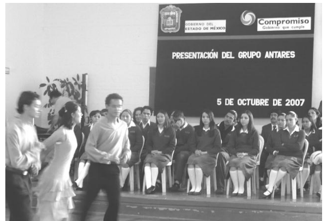
Viernes 5 de octubre: presentación del Grupo Antares de la UAEM con “Baile de salón”.