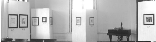
Lunes 22 de octubre: Exposición de la acuarelista Rocío González Páez.