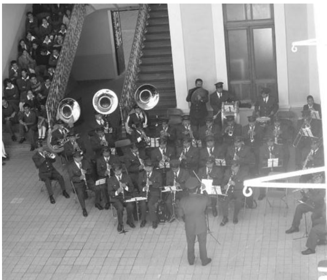
Miércoles 3 de octubre: Concierto “Banda Municipal” de Toluca.